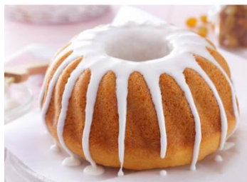
Amelia Głowacka 4b

Śmietanę kremówkę podgrzać w garnuszku. Zdjąć z palnika, dodać posiekaną czekoladę i wanilię, odłożyć na 2 minuty. Po tym czasie wymieszać do powstania gładkiego sosu czekoladowego. W razie potrzeby przetrzeć przez sitko. Przestudzić, by polewa lekko zgęstniała. Babka waniliowa nie musi być przechowywana w lodówce, ale w temperaturze pokojowej, pod przykryciem. Smacznego :-)